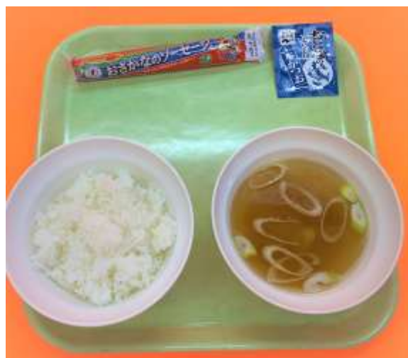
朝はやっぱり白ご飯&みそ汁