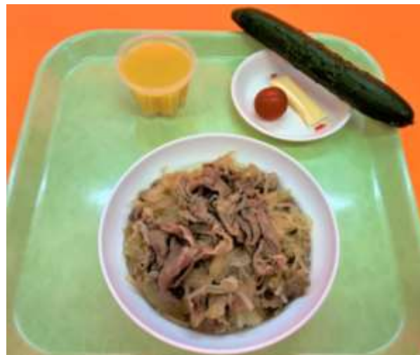
牛肉たっぷりつゆだくどうぞ！