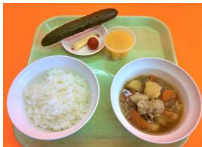
肉・野菜、具だくさんメニュー！