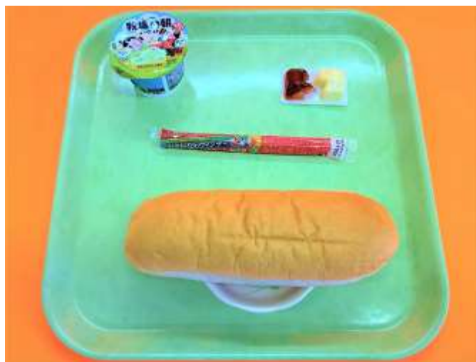
さっと食べられるお手軽メニュー