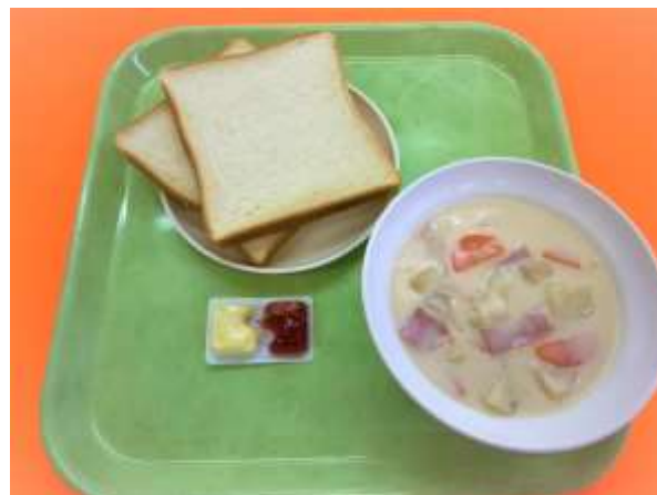
朝はひとなべで、という時に