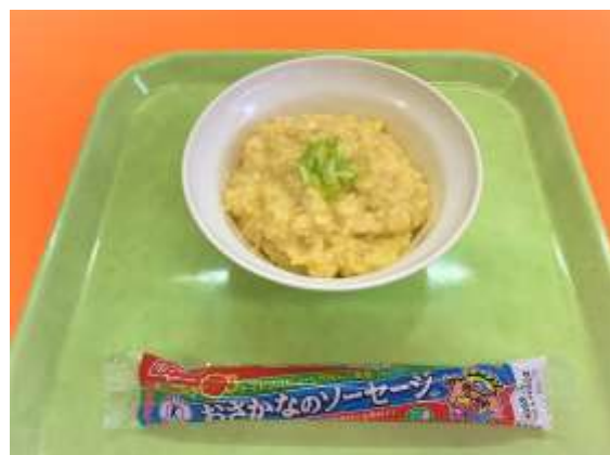
おなかにやさしく 手軽にできる