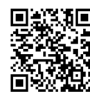
鳥海山・飛島 ジオパーク